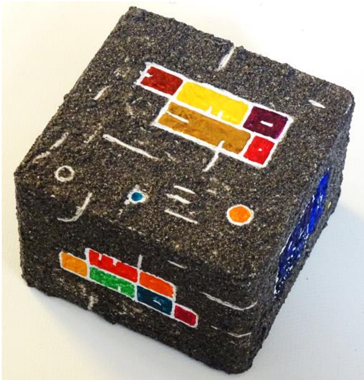
René KleeB Polychromie Würfel Nr.517. Elm Sand (GL) Sand Lascaux Acryl auf Holz 12 x 12 x 8 cm 2018