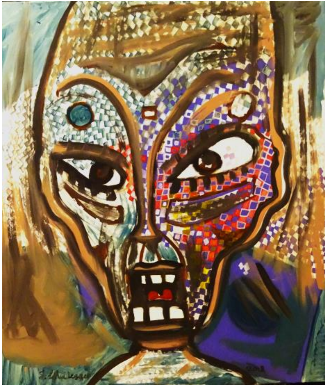
Jonas Scheidegger Öl auf Leinwand 140 x 120 cm 2018