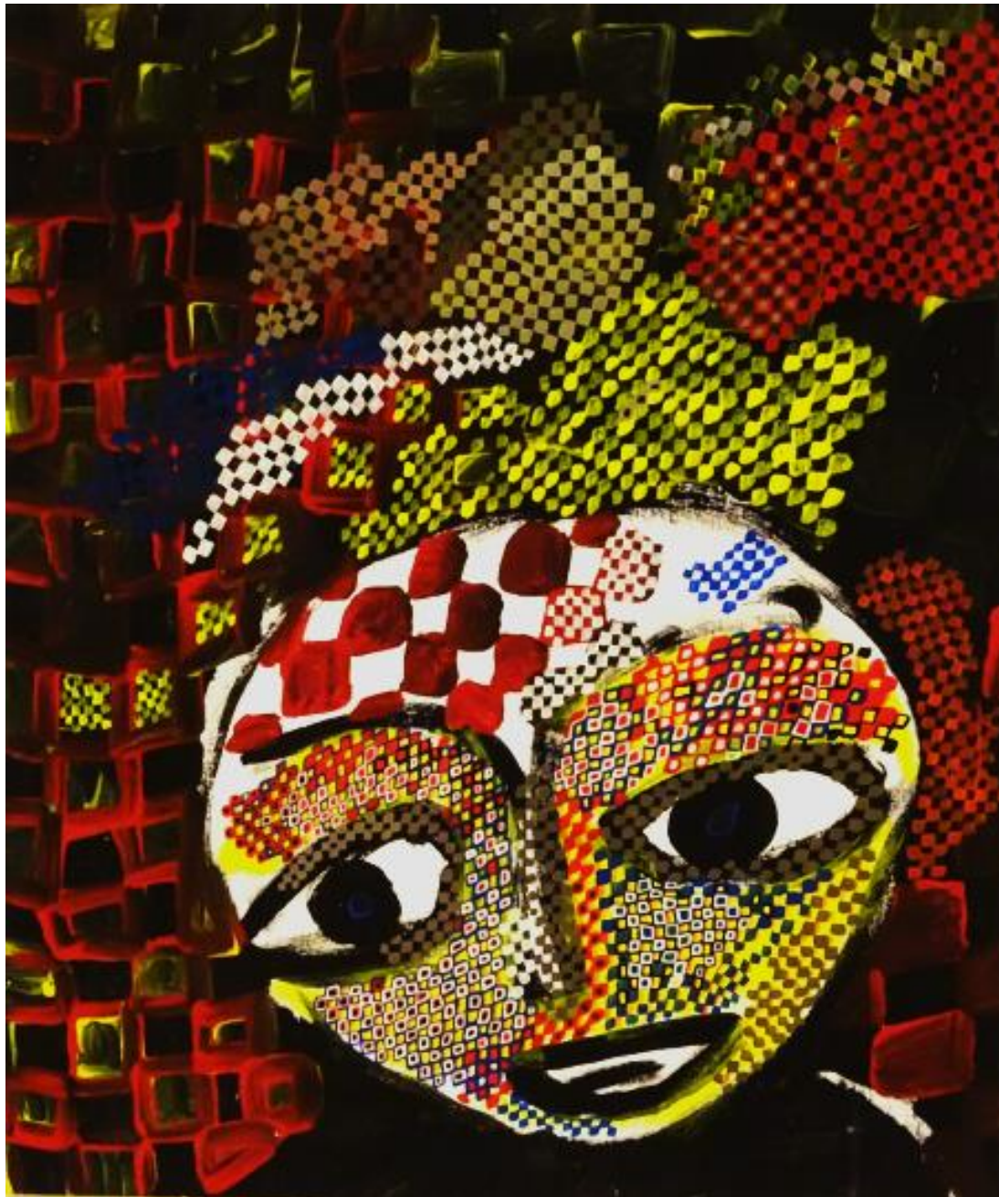
Jonas Scheidegger Acryl auf Malplatte 60 x 50 cm 2018